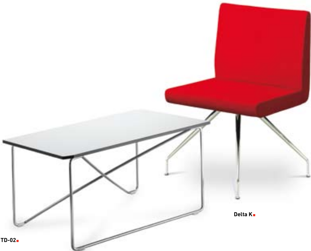
Delta K ■