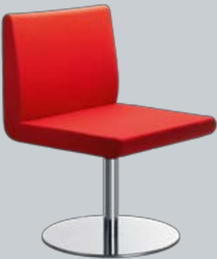
Delta F01 ■