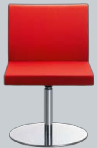
Delta F01 ■