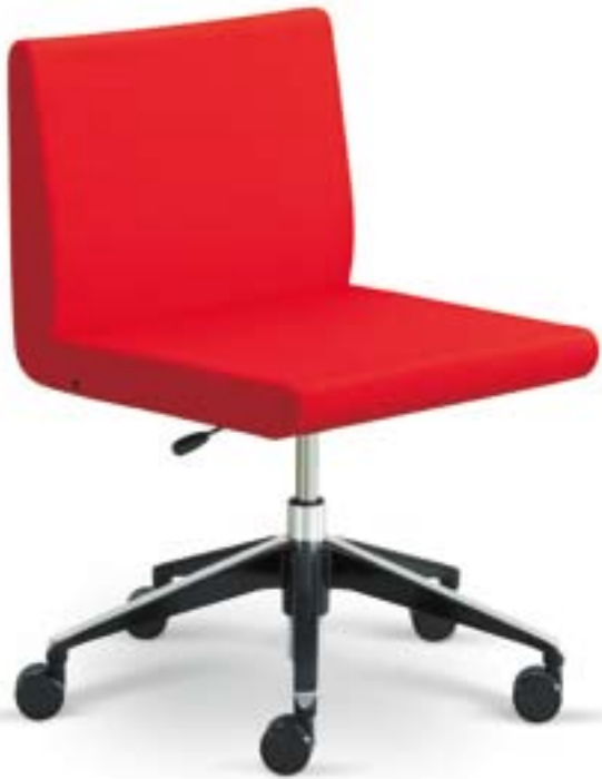
Delta F60 ■