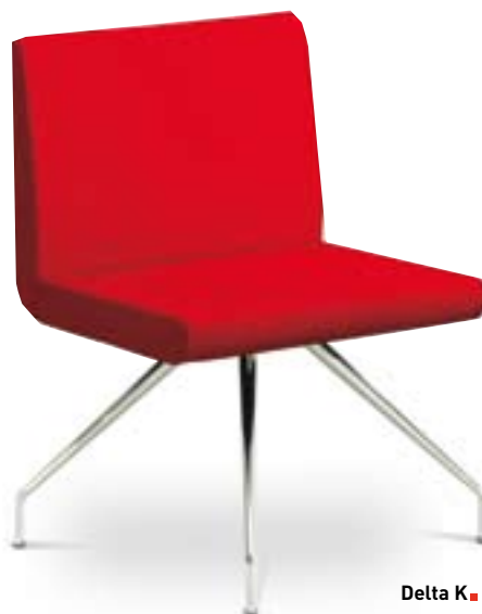
Delta K ■

Delta est un programme dessiné pour tous les espaces d'attente. Delta offre des solutions d'assise pour une à cinq personnes avec ou sans accoudoirs, avec ou sans tablette porte revues. Le siège Delta est conçu à partir d'une structure en acier sur laquelle est injectée à froid une mousse de polyuréthane de haute qualité. L'ensemble garantit un excellent confort et une grande longévité associé à un design intemporel.